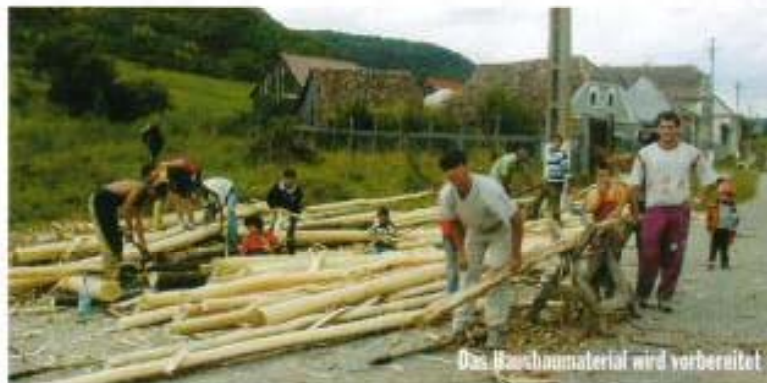
Das Baumaterial wird vorbereitet

♥ Gemeinsam mit 5 jungen Männern aus Alma VII konnten wir ein mit Lehmziegeln und Lehmverputz verkleidetes Holzhaus für die Moldovan's (15 Kinder) erbauen. Damit schafften wir zusätzlich zum alten Haus, welches renoviert wird, 60m 2 Wohnfläche und 350m 2 Heuboden.